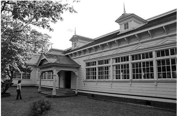
北海道開拓の村に復元保存されている北海道中学校の校舎